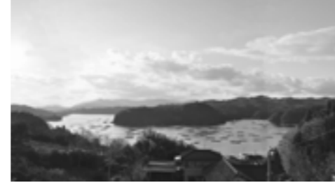
■唐桑町鮭立から宿・舞根付近の湾を望む景色。リアス式海岸特有の入り組んだ地形で、湾内は穏やか

■市長 私には「気仙沼をこんなまちにしたい」という二つの夢というか目標があります。それは、市民の皆さんにとつて分かりやすく、少し遠いけど頑張れば手が届く目標です。一つは「世界に羽ばたく産業のまち」。今は世界を相手にする時代で、日本の中だけでモノを売ったり買ったりするのは限界です。常に世界を意識しながらまちの産業を発展させたい。もう一